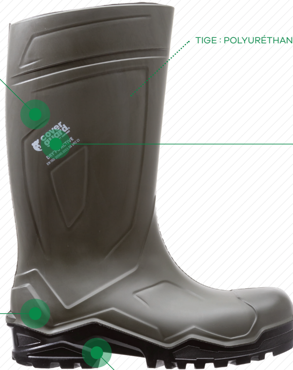
TIGE : POLYURÉTHANE