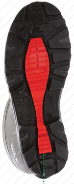
SEMELLE D'USURE AVEC RENFORT CENTRAL TPU